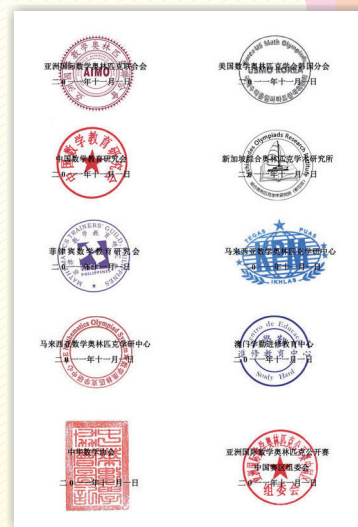
亞洲國際數學奧林匹克聯合會 亞洲各國主辦單位